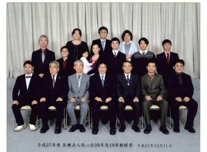
平成27年度 医療法人琉心会20年及10年勤続者 平成27年12月11日