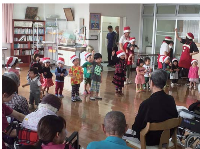
明星保育園の園児がクリスマスソングを歌ってくれました ありがとうございました！